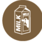
Мляко и млечни продукти