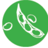
Соя и соеви продукти