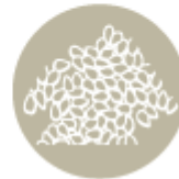
Сусамово семя и продукти от него