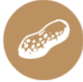
Фъстъци и продукти от тях