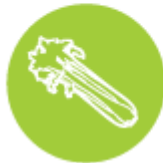
Целана и продукти от нея