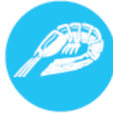
Ракообразни и продукти от тях