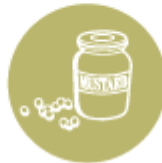
Синап и синапено семя (горчица)