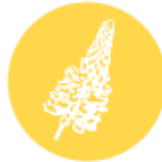
Лупина и продукти от нея