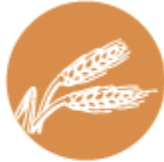
Зърнена култура, съдържаща глутен