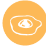
Яйца и продукти от тях